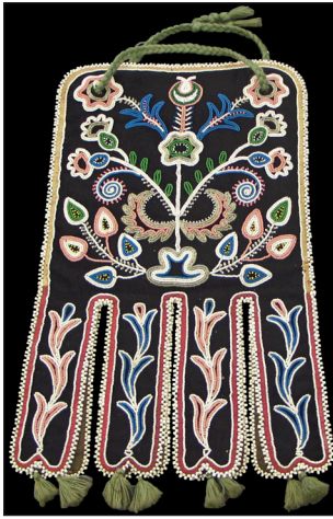
Blague à tabac